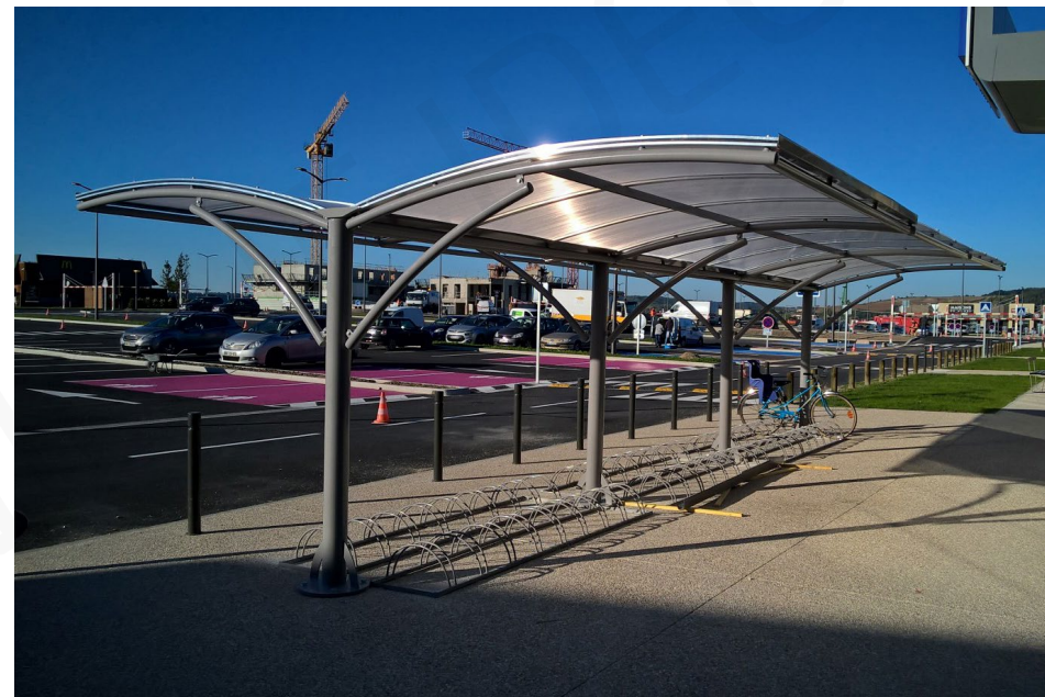
Abri double avec 2 extensions