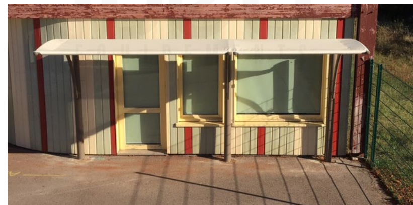
Abri simple avec 1 extension