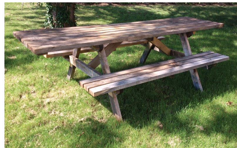
Avec plateau rallongé 2 côtés